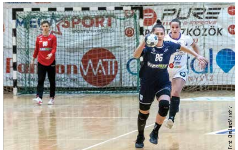
Temesék rutinja egyelőre nem elég

Szerdán a Dunaujváros otthonában is nyílt lehetőség a pontszerzésre. A szünetben 13-13 volt az állás. Végül azonban, ha szorosan is, de 27-24-gyel otthon tartotta a két pontot a Kohász. Az Alba Fehérvár KC a tizenegyedik helyről várja a március végi, váci folytatást.