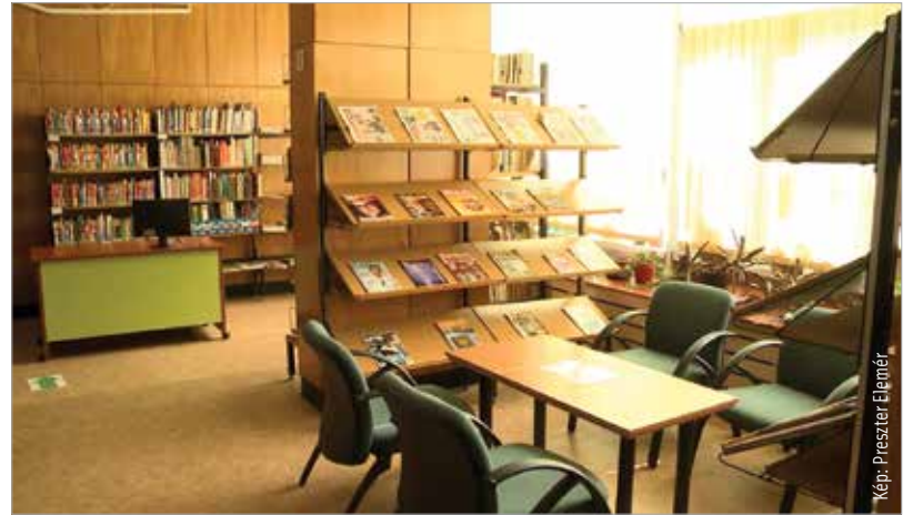
Korszerű, barátságos környezet várja az olvasókat

A munkálatokat a járvány miatti zárva tartás idején sikerült elvégezni – így az újranyitást már a megújult környezetben várja a könyvtár. A munkatársak most a programok összeállításán dolgoznak, és feltétlenül számítanak a régi és új olvasók érdeklődésére!