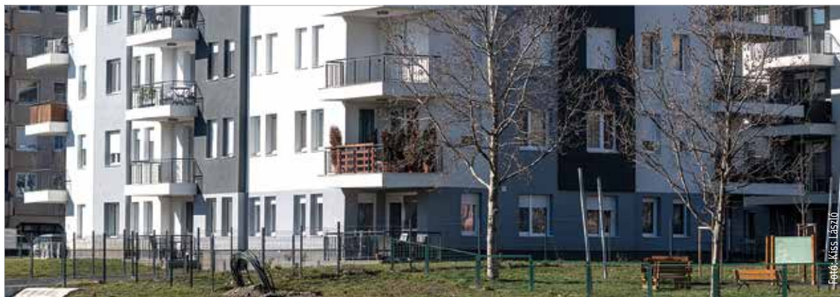
Fehérváron átlagosan négyszázhetvenötezer forint az eladásra kínált ingatlanok négyzetméterenkénti ára

A 2014 körül indult ingatlanpiaci élénkülés után 2019 második fele lassulást, majd a koronavírus-járvány megtorpanást hozott. A szakértők szerint most újabb élénkülésre kell számítani. Fejér megyében fővárosi árakkal kell kalkulálnia annak, aki vásárolni szeretne.