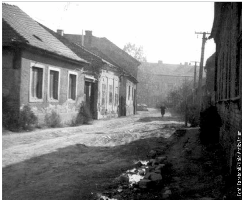
A Könyök közhez hasonlóan a Vas utca is hírhedt volt a fehérváriak körében