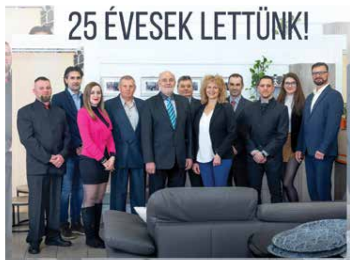
A képen a „Karrier Csapat” látható, sokan már a nyitás óta velünk vannak.

Szinte hihetetlen, de már 1996-ban nyílt meg a Karrier Bútor Kft. bemutatóterme! Eredetileg irodák komplett berendezésével foglalkozó cégünk fokozatosan nyitott a lakossági bútorok irányába is. A tervezéssel, gyártással kibővülve ma már komplex szolgáltatásokat nyújtunk mindkét területen. Sikereink kulcsát munkatársaink szorgalma, kitartása, és vásárlóink, megrendelőink bizalma, hűsége jelenti, ezért elsősorban nekik szeretnénk megköszönni az elmúlt időszakot!