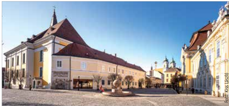
Fehérvár gazdag történelme nyomon követhető a történelmi belvárosban sétálva is. De a készülő könyv ennél sokkal többet nyújt majd!