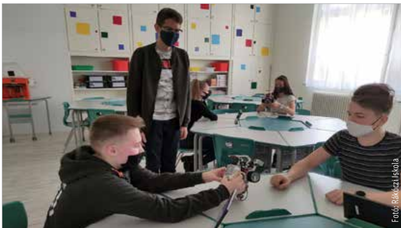
Élvezik az új okostantermet a diákok!

az intézményben. Az okostantermek létrejötténél az Alba Innovár bábáskodott. A cél nem más, mint a gyermekek felkészítése a XXI. század digitális kihívásaira. Az okostantermet nagyon gyorsan belakták a diákok, és ugyanígy vannak ezzel a tanárok is, akik egy pedagógiai program keretén belül sajátították el azt a tudást, melynek révén az okoseszközök segítségével folytathatják az oktatást. Az ünnepélyes átadón Székesfehérvár polgármestere is részt vett. Köszöntőjében Cser-Palkovics András kiemelte: az online oktatás nem a jövő, hanem a jelen!